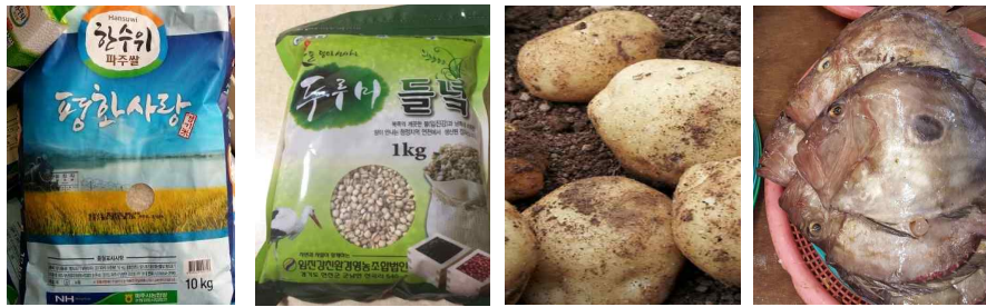
파주 임진강 쌀

- DMZ 접경지역(파주, 연천 등)의 특산물과 남북의 의미있는 식재료 선별