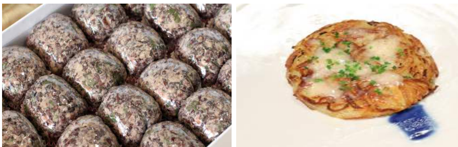
파주 쌀, 연천 울무를 이용한 떡