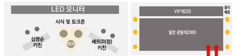
무대 위 배치안