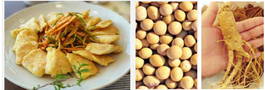
부산 특산물 달고기전